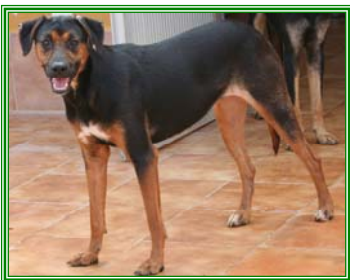
Schaani, weibl., geb.: 06.05