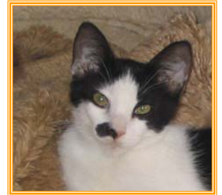
Rene, männl., geb.: 04.04