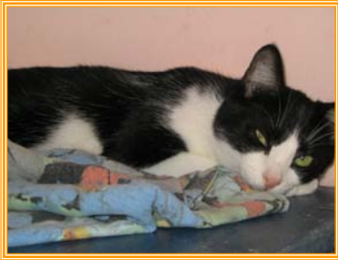
Rodeo, männl., geb.: 04.04