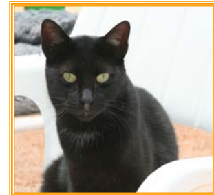
Winny, männl., geb.: 03.03