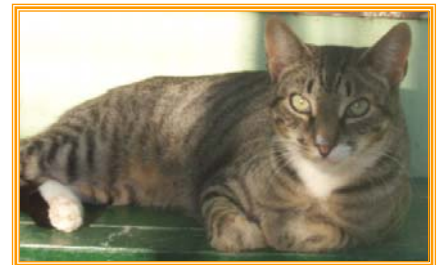
Galypso, männl., geb.: 04.01