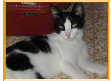
Ricca, weibl., geb.: 04.04