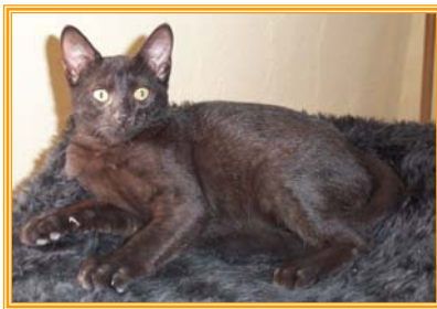
Werny, männl., geb.: 03.03