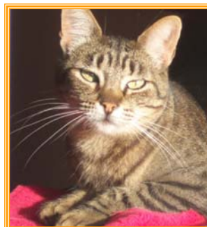
Sinname, weibl., geb.: 03.02