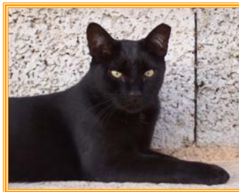
Kali, männl., geb.: 04.96