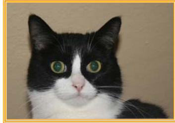
Plata, weibl., geb.: 01.03