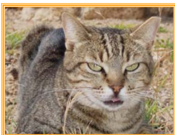
Pia, weibl., geb.: 04.99