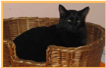
Alia, weibl., geb. 07.03