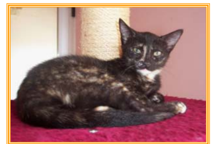
Romina, weibl., geb.: 03.02