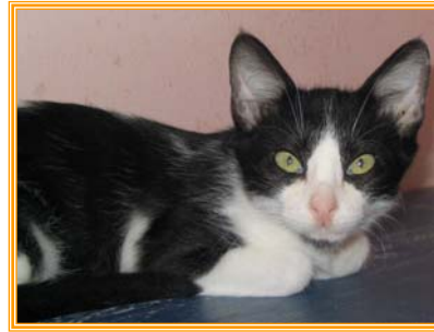
Ruffy, männl., geb.: 04.04