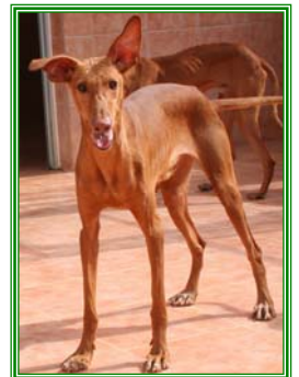
Sandor, männl., geb.: 07.04