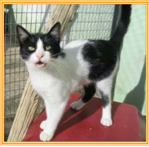
Rango, männl., geb.: 04.04