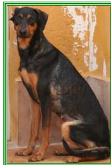
Selma, weibl. geb.: 06.05