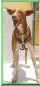
Piero, männl., geb.: 05.05