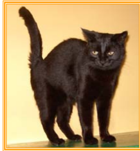
Romy, weibl., geb.: 04.04