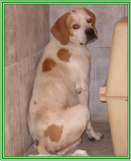
Pavel, männl., geb.: 05.05