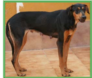
Sonja, weibl., geb.: 06.05