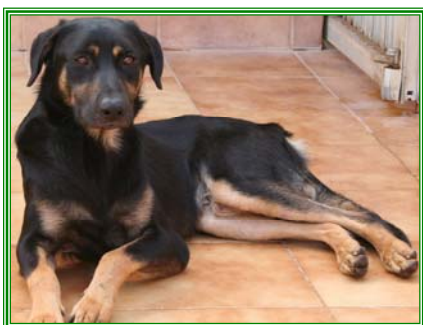
Sascha, männl., geb.: 06.05