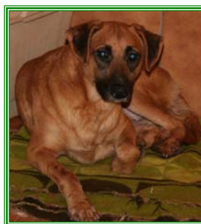
Sinta, weibl., geb.: 06.05