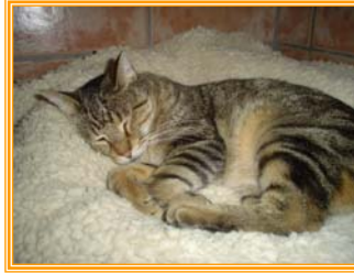
Stripe, männl., geb.: 04.01