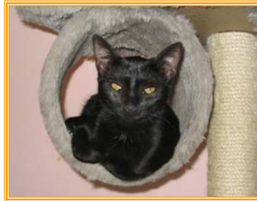
Rella, weibl., geb.: 04.04