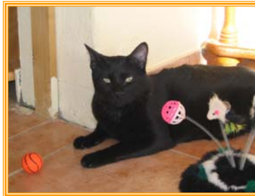
Widy, männl., geb.: 03.03