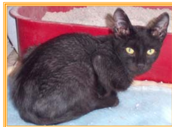
Dulcito, männl., geb.: 09.02