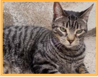
Anuko, männl., geb.: 05.00