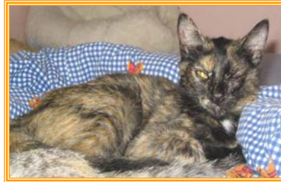
Rehleim, weibl., geb.: 04.04