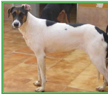
Schika, weibl., geb.: 06.05