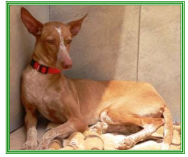
Panina, weibl., geb.: 11.06