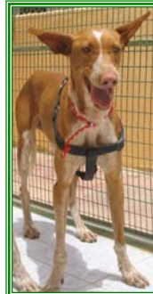
Piedro, männl., geb.: 05.05