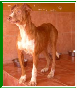
Priscilla, weibl., geb.: 06.98