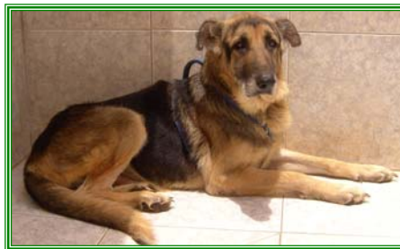
Patou, männl. geb.: 05.04