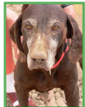
Melissa, weibl. geb.: 06.00