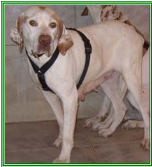
Pucky, männl., geb.: 05.05