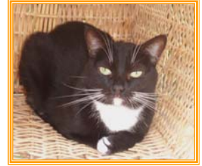
Püppchen, weibl., geb.: 05.97