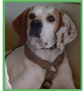
Pluto, männl., geb.: 05.05