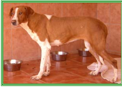
Pritti, weibl., geb.: 06.04