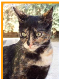
Romika, weibl., geb.: 03.02