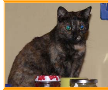
Toscha, weibl., geb.: 10.00