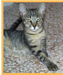
Pappy, weibl., geb.: 04.01