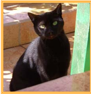
Grisu, männl., geb.: 03.06