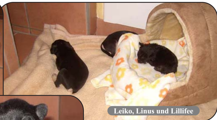
Leiko, Linus und Lillifee