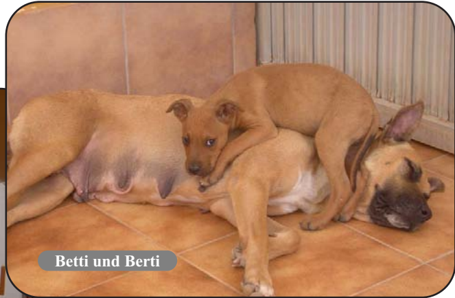
Betti und Berti

Betti und Berti haben sich gut eingelebt und Berti klebt wie eine Klette an seiner Mama.