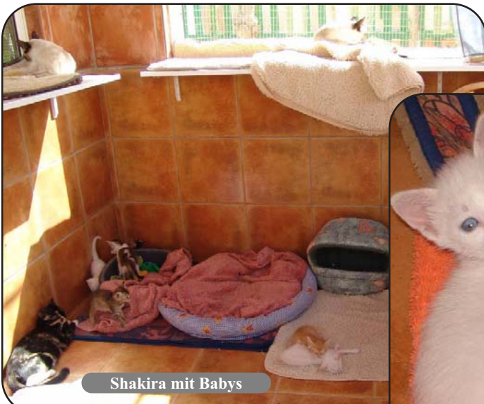
Shakira mit Babys