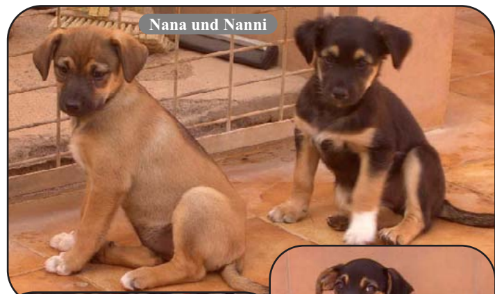
Nana und Nanni

ihm kastrieren lassen würden. Nita, Nils, Nana, Nanni, Nara, Natz, Nike, Nino und Nata kamen zu uns.