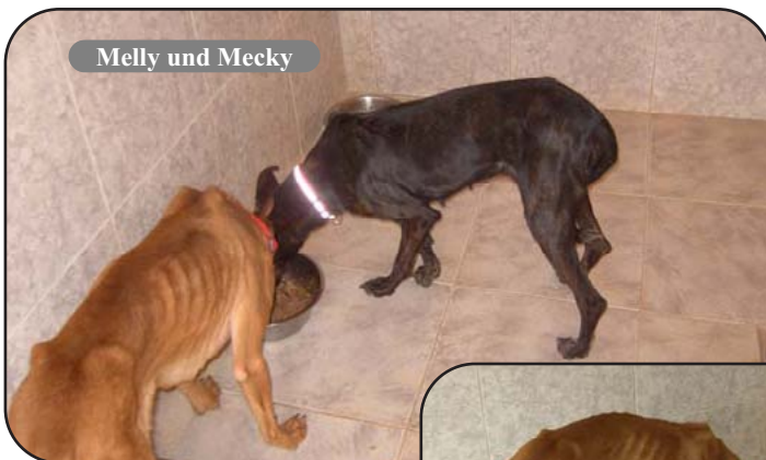
Melly und Mecky

Ein alter Spanier klingelte am Hoftor. Ich erkannte ihn sofort wieder, er hatte vor ca. einem Jahr bei mir die beiden Jagdhunde Muck und Mucki abgegeben. Nun stand er wieder mit zwei Tieren am Tor. Sie waren sehr abgemagert und der Spanier meinte, er könne auch diese Hunde nicht behalten, sie würden nicht zur Hasenjagd taugen. Aber er wolle die zwei, Mecky und Melly, nicht töten, er würde sie uns schenken. Natürlich nahmen wir sie auf. Wenn nicht, wäre das ihr Todesurteil gewesen. Ausgehungert stürzten sie sich auf das Futter.